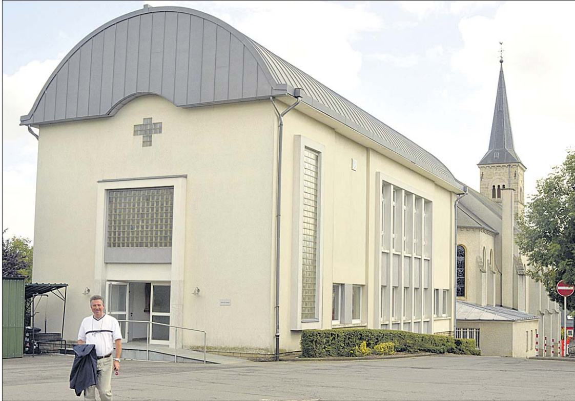
Im runderneuerten Home werden in den kommenden drei Jahren die Schulauffangstrukturen der Gemeinde Dippach untergebracht.

Unterkunft für Vereine und Schulauffangstrukturen